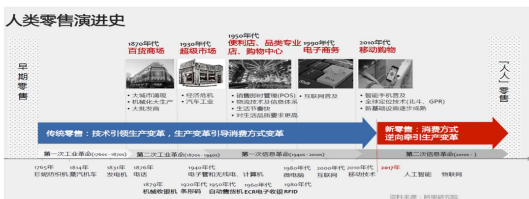
圖 14-1 人類零售演進史

電商與新零售是全世界都在做的大趨勢，在導入智慧農業的生產後，確實也應開始及早規劃如何將農業結合電商、數位商務等綁在一起之新零售模式，畢竟既有的市場通路可能已無法滿足新思維，這將是農業面臨最艱難的挑戰。