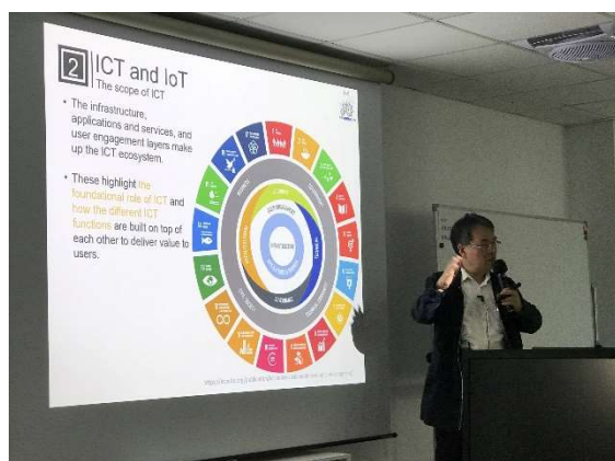
圖 6-3 江昭皚教授上課照片