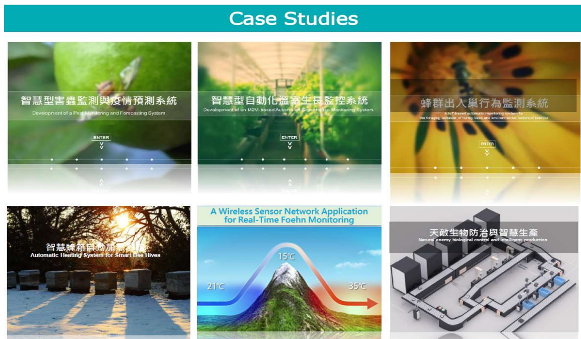
圖 6-2 實例講解